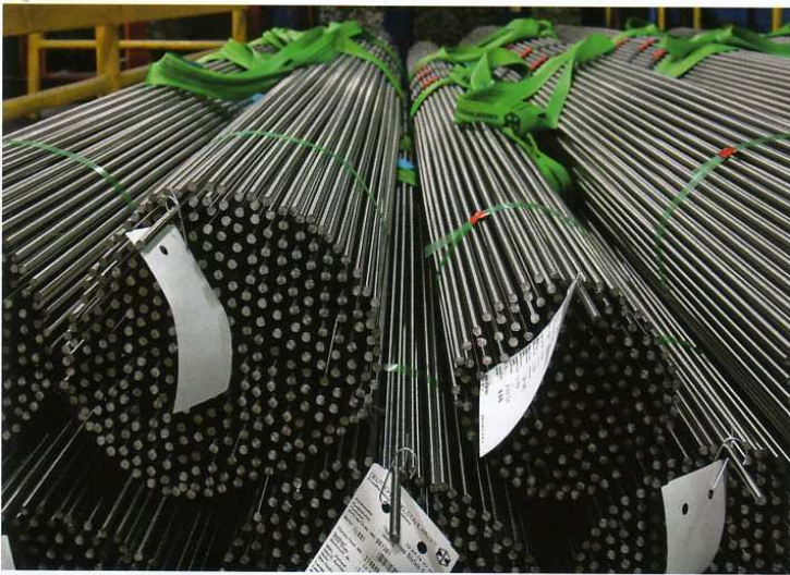
Zwei Strategien dominieren im Lagermanagement: Entweder werden alle Einzel- oder Rohteile bei Produktionsstart ausgebucht, oder sie gelten so lange als „nicht ausgegeben“, bis das Endprodukt fertig ist.

Wird die Fertigung komplexer, lässt sich für Disposition und Vertrieb schwieriger feststellen, wann und wo mit wie vielen Endprodukten zu rechnen ist, ob Lagerplätze frei oder belegt sind und welche Einzelteile tatsächlich bereit stehen. Dem zu begegnen, hat Wühler+Gebauer für ihre ERP-Software ein eigenes Managementsystem entwickelt.